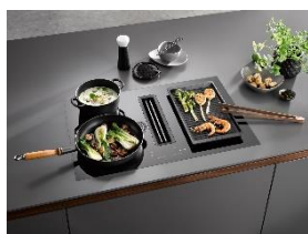
Immagine 2: Premiato con l'iF Design Award 2023 e reddot winner 2023, il modello KMDA 7473 Silence, con due zone di cottura combinabili tra loro tramite una funzione ponte, ad esempio per la piastra grill Gourmet.