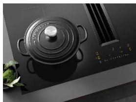
Immagine 1: Il piano cottura a induzione Miele KMDA 7272 Silence si è aggiudicato l'iF Design Award 2023 per il suo design accattivante ed elegante, affermandosi anche come reddot winner 2023.